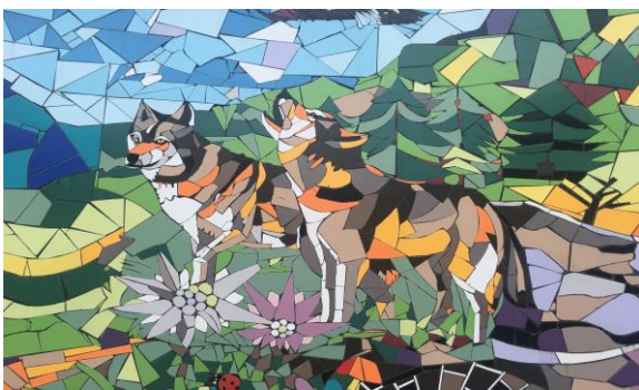
Détail de l'immense fresque de la vie rurale, Caprauna, Ligurie, Italie, septembre 2023.