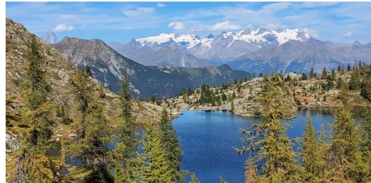
Le lac Blanc, près du refuge de Barbustel.

A partir de Pontboset (vieux village authentique de la vallée de Champorcher en Val d'Aoste) nous avons bénéficié d'une semaine exceptionnelle avec la montagne presque pour nous seuls, sous un ciel insolemment bleu alors que nous étions début octobre.