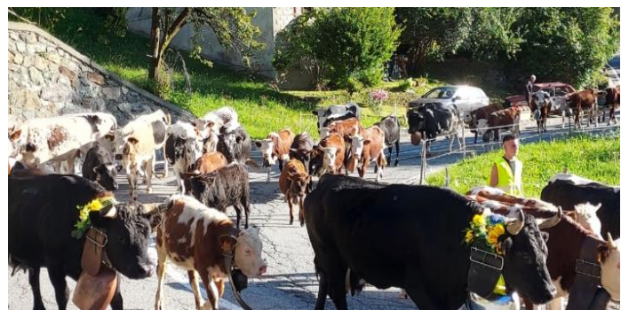
Retour d'estive, Pontboset, Val d'Aoste, Italie, septembre 2023.