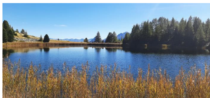
Le lac du Milieu, Le Lauzet-Ubaye