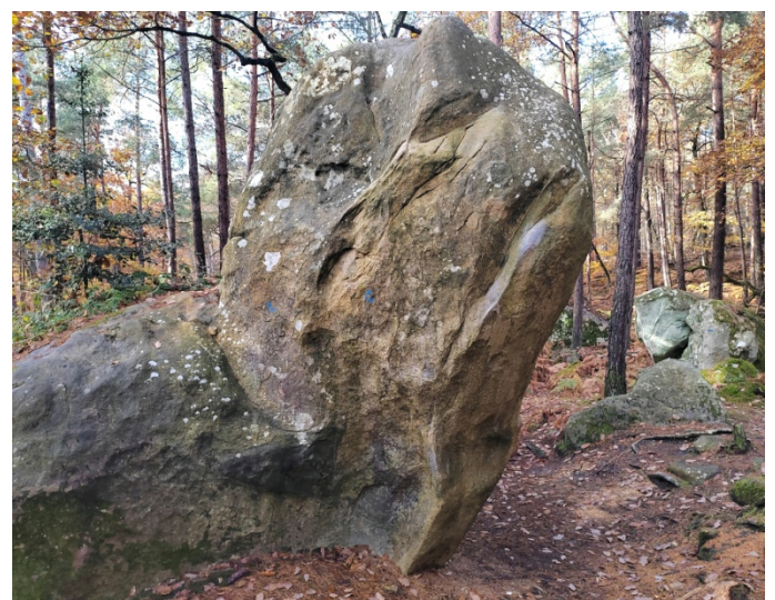
Bleu n°34 et Bleu n°35