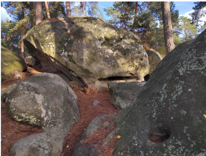
Bleu n°20 et Rouge n°18