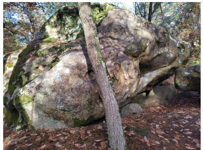
Bleu n°30 et Rouge n°27