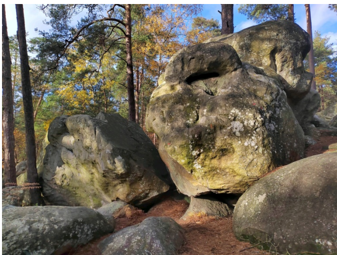
Orange n°31, Bleu n°28 et Rouge n°25