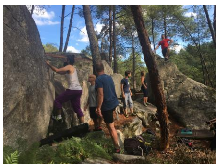
Sortie découverte blocs le 11/09, Gorges du Houx.