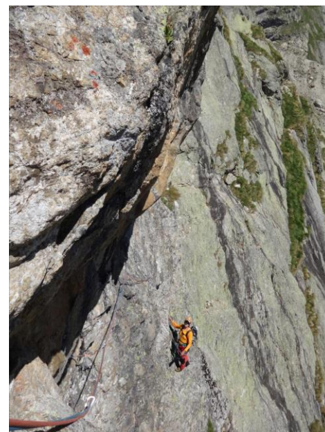
En Italie, Val Veny, Pre De Bar Via Edelweiss L6.