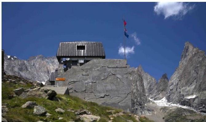
En Italie, camp alpin, Val Veny