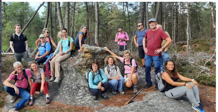
Sortie découverte du 11/09, Franchard, Gorges du Houx.