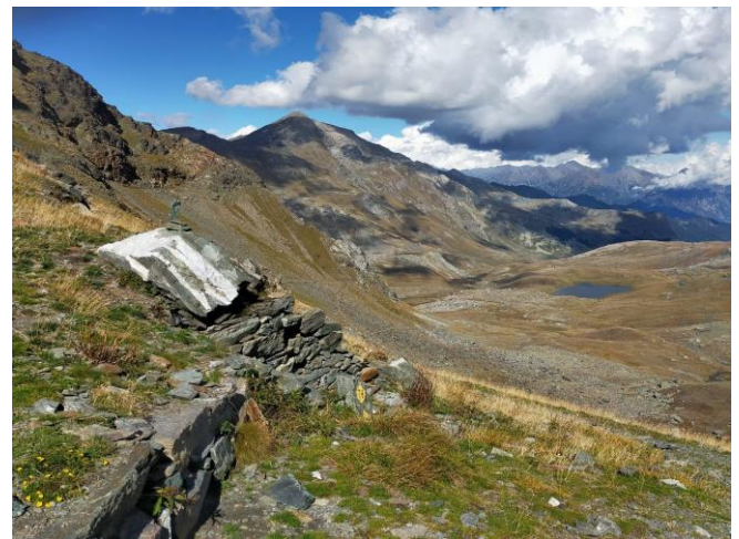
Randonnée en Val d'Aoste, col du Pontonnet et l'ombre portée du groupe.