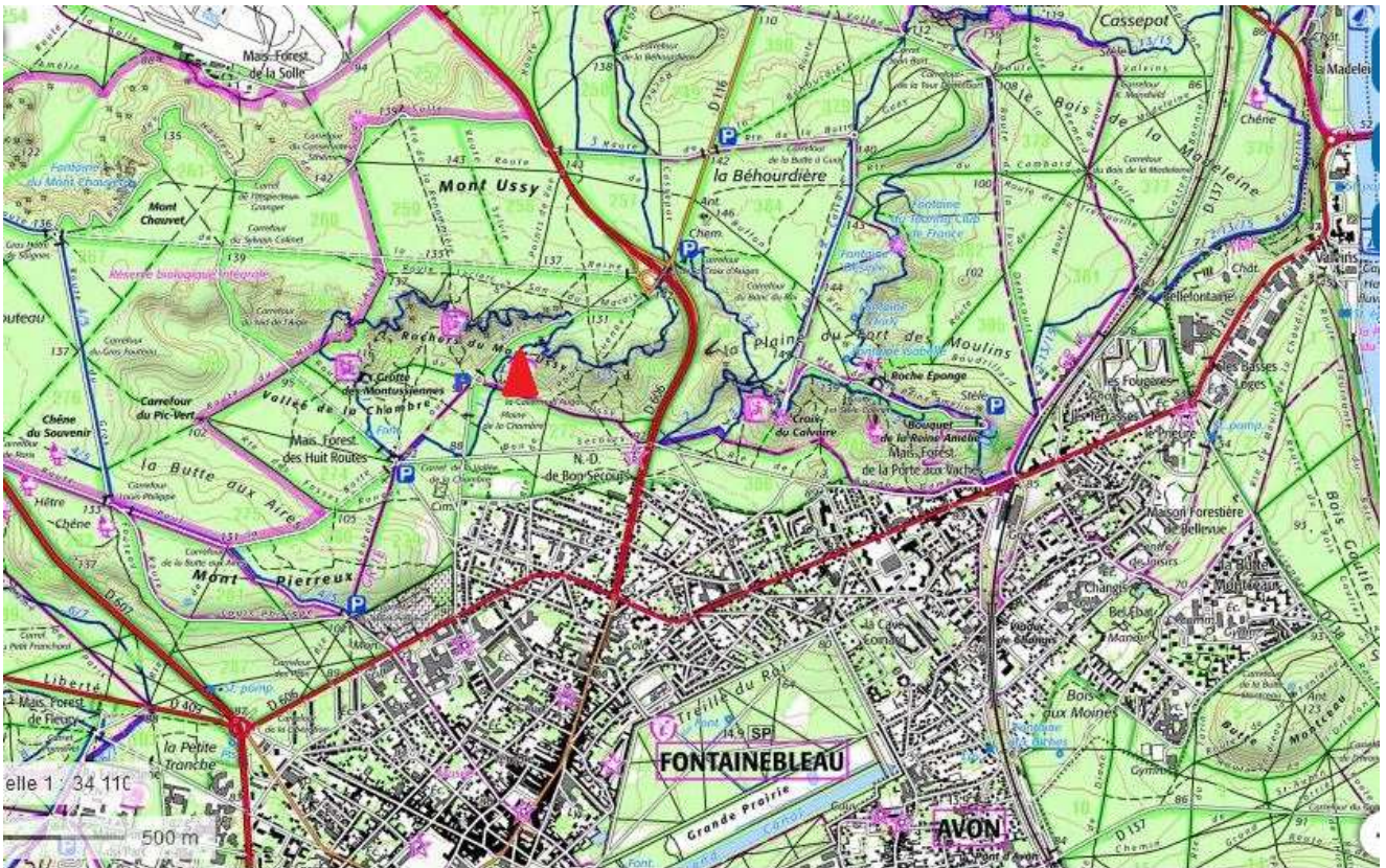
Départ n°1 et n°14

Accès et approche : depuis le feu rouge du carrefour en bas de la côte qui monte à Melun (D606, ND du Bon secours), on prend la petite route (« de la Bonne Dame ») vers l'Ouest et on tourne à droite au bout de la ligne droite (route Louise). 150 mètres après, on arrive à un petit parking aménagé, d'où l'on voit la Roche d'Hercule à droite. Le départ du circuit est visible sur un petit bloc en-dessous à sa droite.